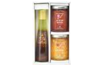
フルーツジャム2個・ドレッシング1本詰合せ(JDB-O4)

素材の持ち味を大切に色や香り・果肉感や食感を楽しめるフルーツジャム、野菜・ごま等の具材感がありオリジナルのハーブピネガー・ハーブオイルを使って仕上げた味わい深いドレッシング、ヨーグルトやパンケーキにお使いいただけるフルーツソースの詰合せです。