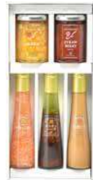
ジャム2個・ドレッシング3本詰合せ(JDS-F)