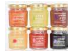
山形県産ミニジャム6個詰合せ(MJ-O6D)