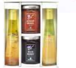
ジャム2個・ドレッシング2本詰合せ(JDB-SG)