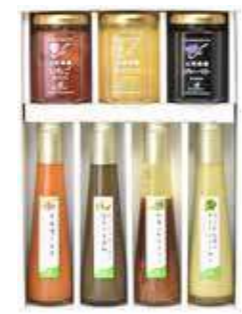
山形県産ジャム3個・YAMAGATAドレッシング4本詰合せ(JD-O7)