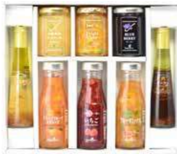
バラエティセット(Y-O6)