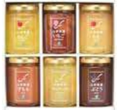
山形県産ジャム6個詰合せ<FJ-O6H>