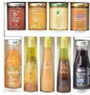
バラエティセット(P-O8)