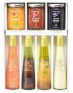
ジャム3個・ドレッシング4本詰合せ(JD-O6)