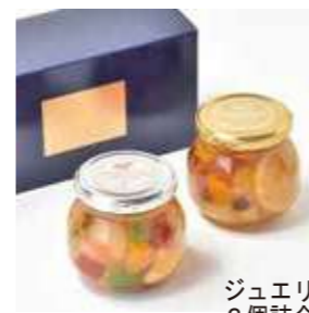
ジュエリーボックス・フルーツティー2個詰合せ(3OB-SB)

パンケーキやヨーグルト、クラッカーなどのトッピングとしてお使いいただけるミックスジャム2種類の詰合せです。