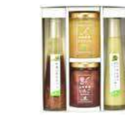
山形県産ジャム2個・YAMAGATAドレッシング2本詰合せ(JDB-SI)