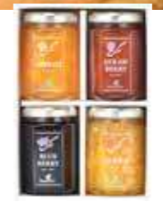
フルーツジャム4個詰合せ<FJ-O4E>