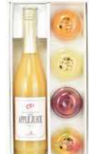
ジュース・フルーツゼリー詰合せ<J-J-O1B>