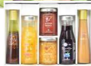
バラエティセット(S-V-G)